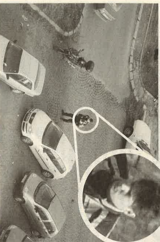
TRASEU. Motociclistul l-a ținut calea procurorului de la Unirii până la Casa Presei, fiind specializat de intrarea pe străduțele înguste