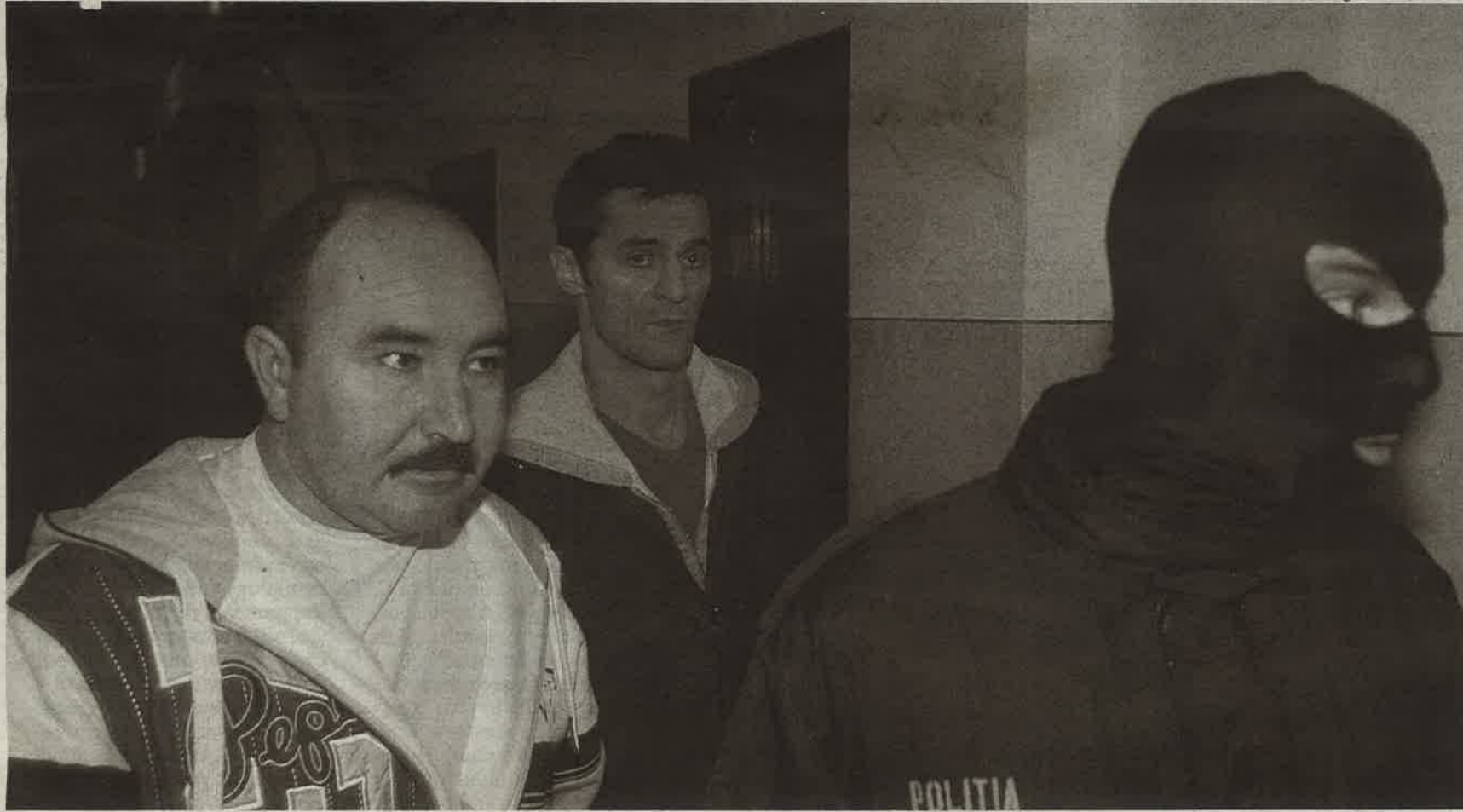
Grupările „Cămătarii” și „Sportivii” erau specializate în săvârșirea de infracțiuni de violență – șantaj, cămătărie, tentativă de omor calificat și omor deosebit de grav