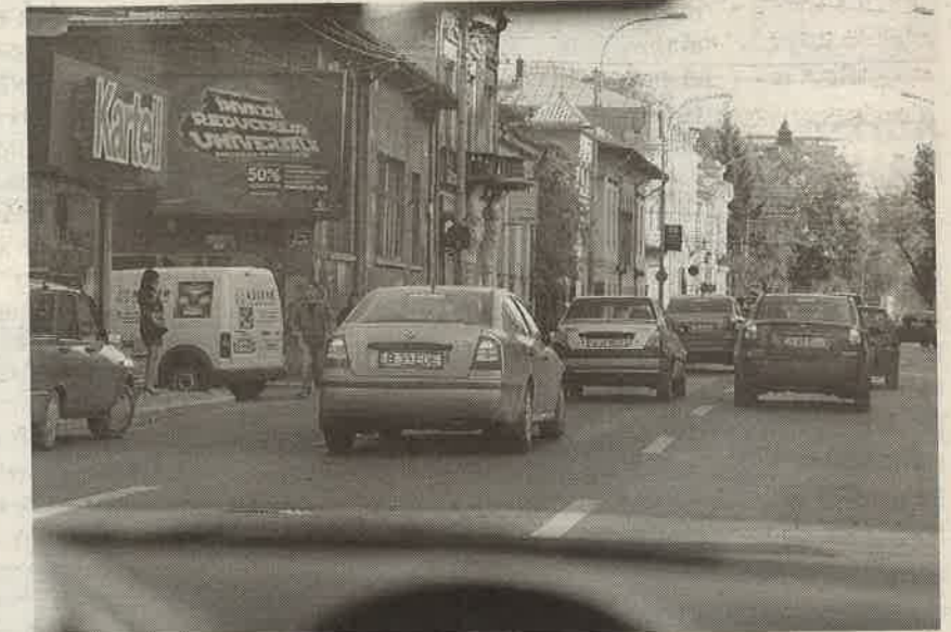
URMĂRITORII. „Internele“ aruncă mașinile B-39-EGE, B-64-SGT, B-49-ELU pe capul civililor